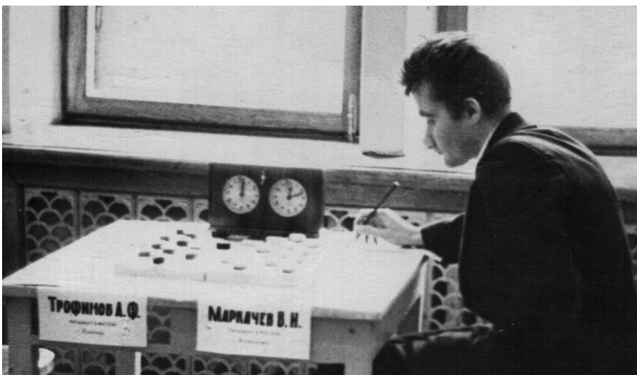
На соревнованиях в нижнем Тагиле, 1965 год

Логический талант, усердные занятия и опыт наставника