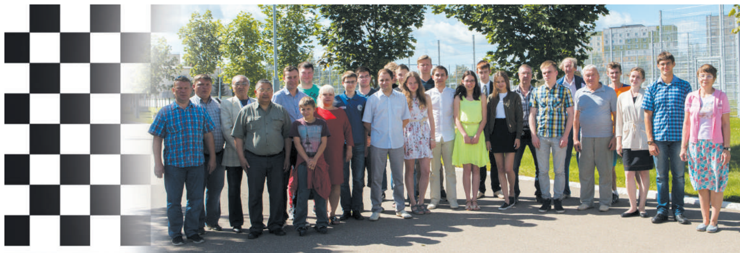
Всероссийский турнир «Мирный Атом» объединил участников из 11 регионов