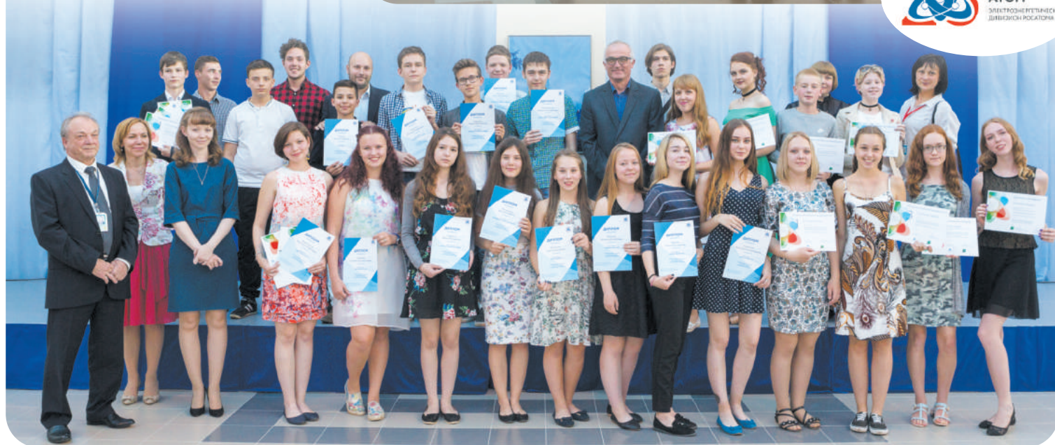
Участники конкурса фотографии в Удомле